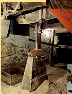
Telaio e carro