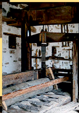
Rullo e corda