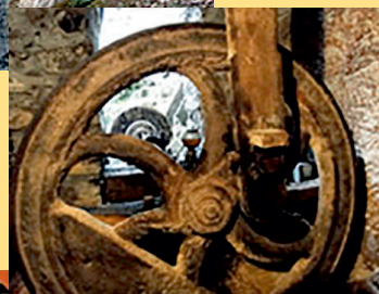
Organi di trasmissione